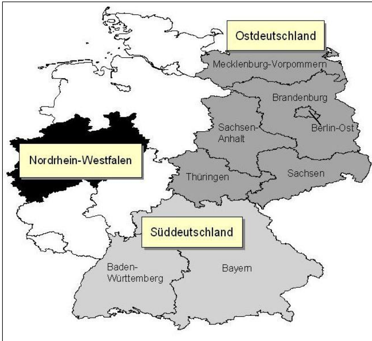
Karte: Markus Steinmetz